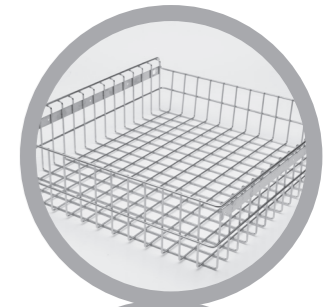
Cestello in acciaio inox Stainless steel basket