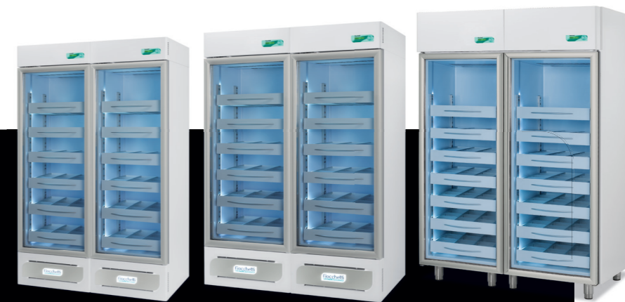
Medika 800 2T

1500 lt (700+700) L 1500 (750+750) P 840 H 2100