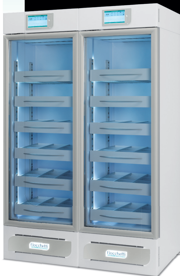
Medika 800 2T

800 lt (400+400) L 1200 (600+600) P 655 H 1955