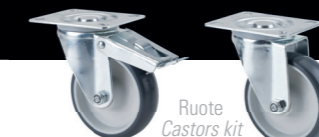
Ruote Castors kit