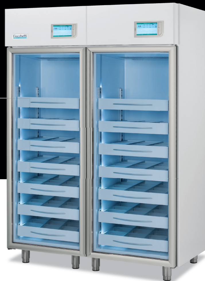
Medika 1500 2T

1000 lt (500+500) L 1440 (720+720) P 765 H 2080