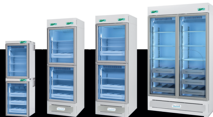
Medika 280 2T Medika 400 2T Medika 500 2T Medika 600 2T

The professional refrigerators range MEDIKA 2T have been designed specifically for pharmacies and pharmaceutical sector: two temperature settings, two cooling units and two totally independent chambers to store at best different groups of products. Each chamber can be set independently between +2° and +15°C and is provided as a standard with acoustic and visual alarms. This range offers units with different capacities, from 280 to 1500 liters, all supplied with triple layer glass doors and can be customized as far as the internal fittings (with shelves and/or telescopic drawers). The range MEDIKA 2T complies with Italian pharmacopeia and European drugs storage normative and it's available in ECT-F, ECT-F PLUS or ECT-F TOUCH version.