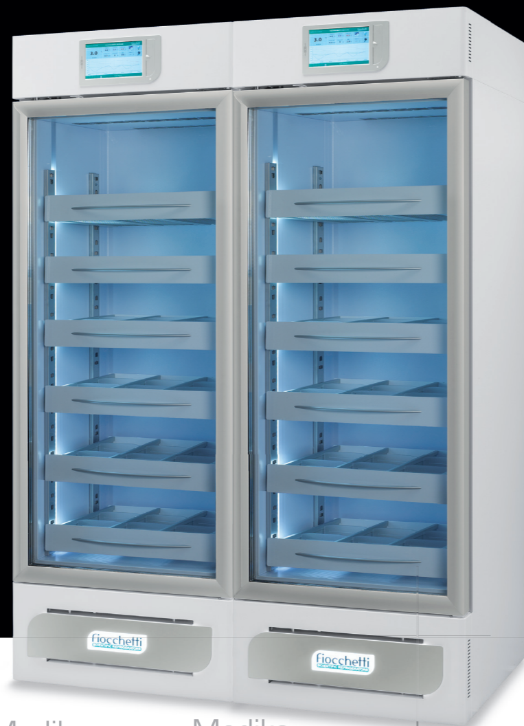
Medika 1000 2T

800 lt (400+400) L 1200 (600+600) P 655 H 1955