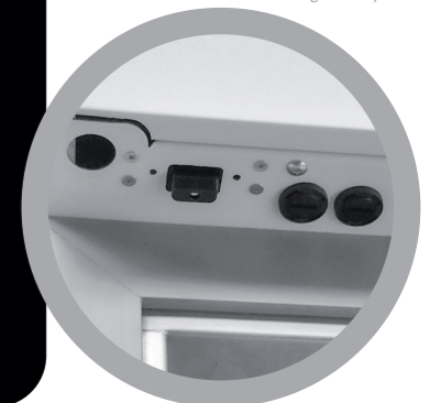
Serratura elettronica Electric digital key lock