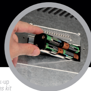
Kit Batterie back-up Back-up batteries kit